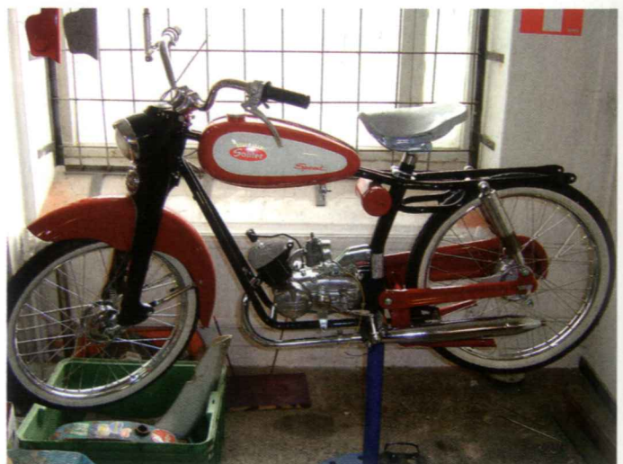
Timo Palmun upea Solifer Speed Standard 1959 lähes valmiina museotarkastukseen.

Vuokrattua tilaa on arviolta reilusti yli 200 neliötä, mutta ei kaikkien mielestä vieläkään riittävästi. Remonttiverstas, maalaamo, biljardipöydän koristama kahvio/kokoontumishuone sekä varastotilojen muodostama kokonaisuus on alkanut näyttää jopa ahtaalta vuosien mittaan. Aktiivisia kaveruksia on kolmisenkymmentä ja kannattajajäseniä parikymmentä.