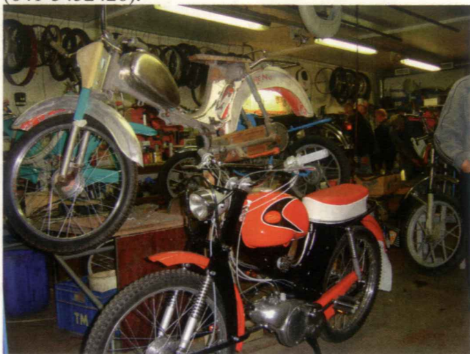
Verstastilan elämää. Edessä Tunturi Sport 1961 valmiina ajoon.

Vierailin 29.8.2012 Salpausselän Mopoharrastajien tiloissa Lahden Sopenkorvessa. Olen kyllä usein aikaisemminkin käynyt siellä, mutta nyt halusin ikuistaa lehtemme muutamin kuvin vireän mopokerhon toimintaa esimerkiksi muillekin.