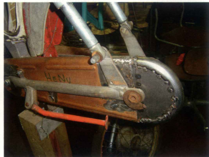
Taivutettu halkaistu putki ja peltikytkin raakahitsattu- na Safirin ketjusuojan takaosana.

Toivotan menestystä teknisten nikkien oppimiseen, liikenneturvallisen käyttäytymisen esimerkin antamiseen sekä ennen kaikkea sisäisen mielihyvän tunteisiin niin Samohan joukolle kuin muillekin mopokerhoille!