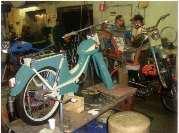
Monark 60-luvun vaihteesta. Ilo Piano-kone odottaa vielä asennusta.