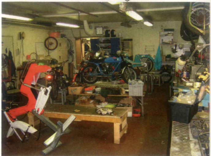
Telineitä ja pukkeja helpottamassa hommia.